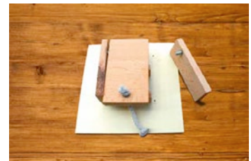
Hier nur ein Beispiel! Die Bodenplatte wird erst zum Schluß angeschraubt.

Nehmen Sie die Bolzen und führen diese in die für den Kippmechanismus gebohrten Löcher ein. Nehmen Sie die Seitenteile und führen diese an die Bolzen. Fügen Sie die Front- und Rückpartie ein und verschrauben alles miteinander. Achten Sie beim Verschrauben auf Leichtgängigkeit des Deckels. Wenn alles verschraubt ist, wird noch das Loch für die Schnur mit dem 5mm Bohrer gebohrt und die Schnur geknotet. Das Loch sollte mittig und so gebohrt werden, dass der Knoten auf der Frontpartie aufliegt, um Geräusche beim Zufallen zu vermeiden.